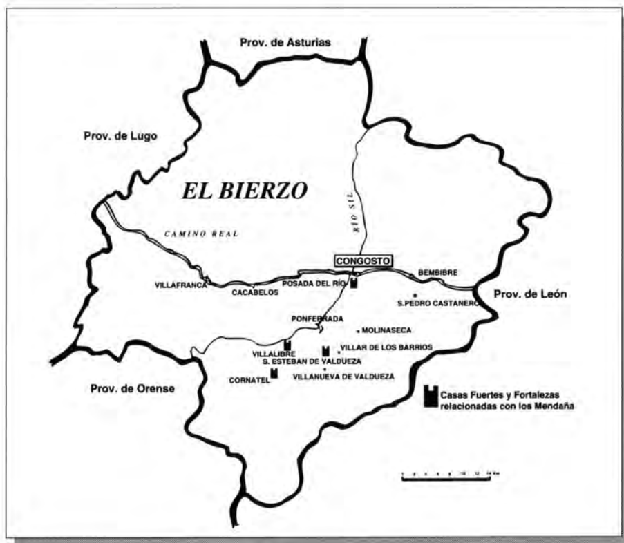
Mapa de El Bierzo, con las casas fuertes de los Mendaña en el siglo XV.

los Mendaña casas fuertes, al margen de la citada de Molinaseca, en Posada del Río, en S. Esteban de Valdueza, y en Villalibre, y además un miembro de este linaje ser alcaide, en esas mismas fechas de finales de siglo, de la fortaleza berriana de Cornatelo, perteneciente a los condes de Lemos, (15). Como podemos ver en el mapa que adjuntamos todas ellas están cerca de los lugares y villas de Villanueva de Valdueza, Los Barrios y Congosto, lugares muy relacionados con los Mendaña durante los siglos XV, XVI y XVII.