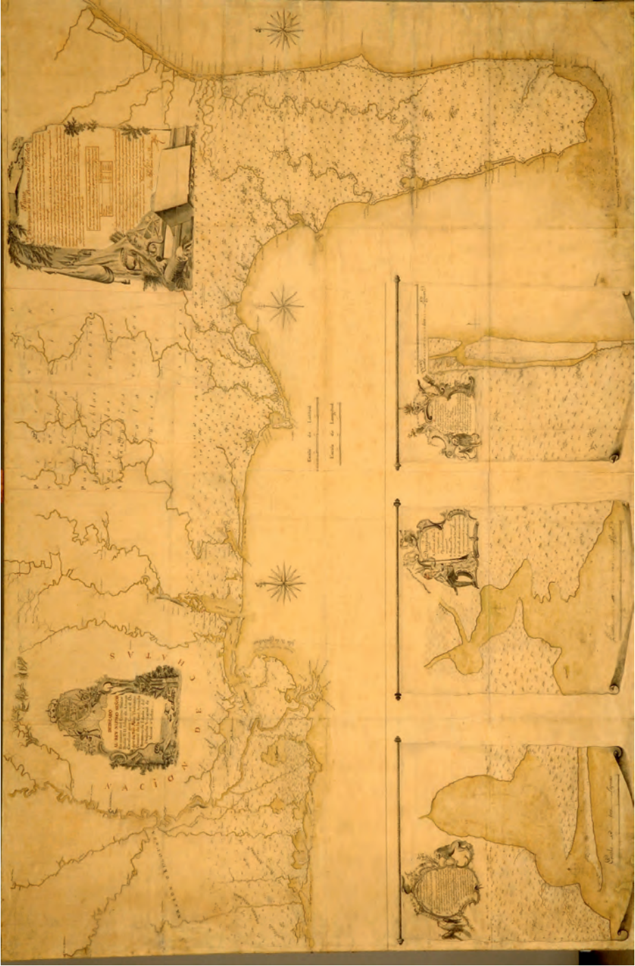
43 «Plano y descripción de las Provincias de Florida», de Juan Joseph Eligio de la Puente, 7 de septiembre de 1769. Museo Naval de Madrid