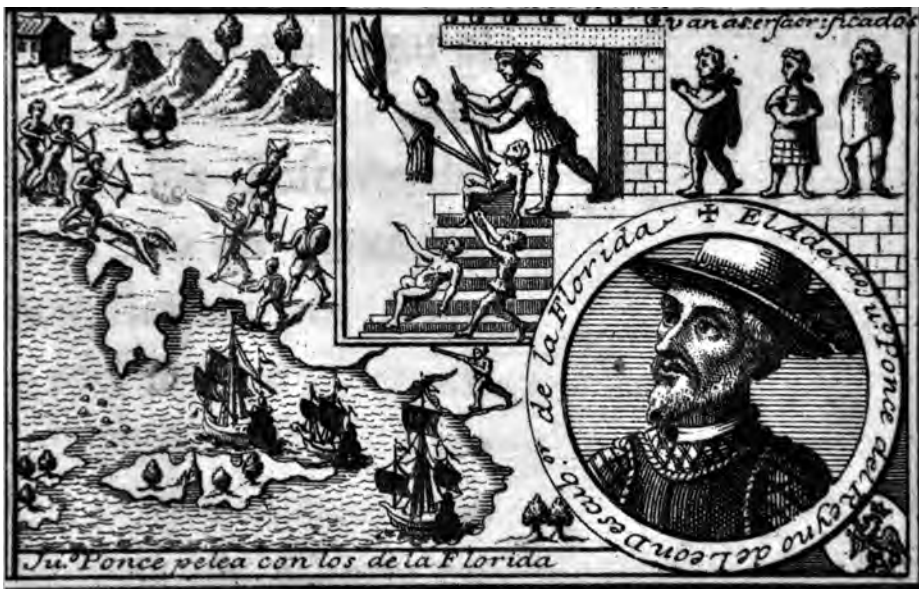
Retrato de Juan Ponce de León en Historia general de los hechos de los castellanos en las Islas y Tierra Firme del Mar Océano (1601), de Antonio de Herrera y Tordesillas (Museo Naval de Madrid)

una fuente tan notable que, bebiendo de su agua, rejuvenecen los viejos. Y no piense Vuestra Beatitud que esto lo dicen de broma o con ligereza: tan formalmente se han atrevido a extender esto por toda la corte, que todo el pueblo y no pocos de los que la virtud o la fortuna distingue del pueblo, lo tienen por verdad» (10).