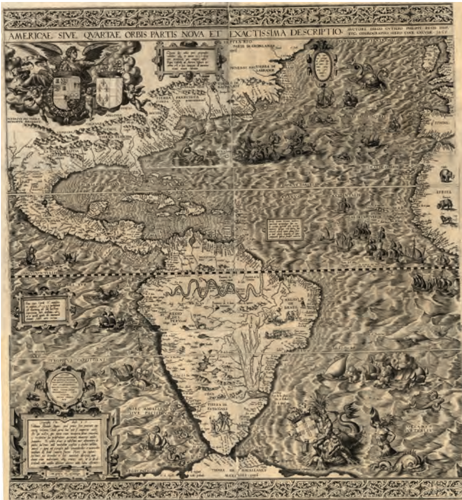
Americae Sive Qvartae Orbis Partis Nova et Exactissima Descriptio , de Diego Gutiérrez (1562). Biblioteca del Congreso, Washington

Precisamente de la Casa de la Contratación salió, por encargo de Felipe II –con el objetivo de mostrar la consolidación de España como potencia mundial–, el mapa de Diego Gutiérrez de 1562.