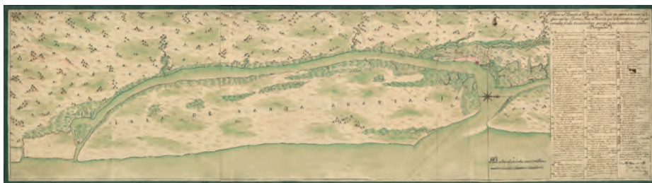
«Plano del presidio de San Agustín de la Florida», de Juan José Eligio de la Puente. La Habana, 18 de febrero de 1769. Museo Naval de Madrid

Sur. Está dedicado al rey y a Julián de Arriaga, teniente general de la Armada y secretario de Estado y del Despacho Universal de Marina e Indias. En el mismo se detalla la vegetación, la toponimia hispana y franca, los fuertes y una detalladísima representación de la red hidrográfica y de las poblaciones y accidentes costeros. También es necesario mencionar la nota explicativa de las divisiones territoriales y posesiones de los indios: «Nación de Chatas, Pueblos de los Yndios de Cabeta, Pueblos de los Yndios Jalapuses y Pueblos de los Yndios [Apuasca]».