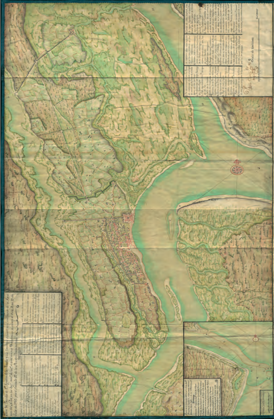
«Plano del Presidio de San Agustín de la Florida y sus Contornos», de Pablo Castelló [1763]. Museo Naval de Madrid