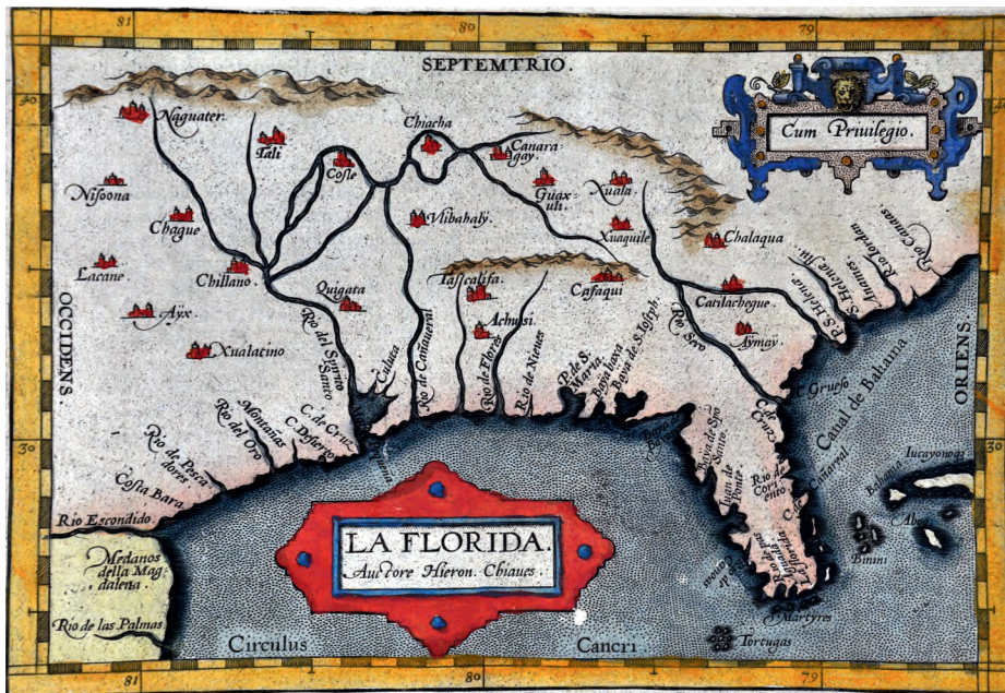
La Florida en Theatrum Orbis Terrarum , de Abraham Ortelius (1584). Museo Naval de Madrid

«A distancia de trescientas veinticinco leguas de la Española, cuentan que hay una isla, los que la exploraron en lo interior, que se llama Boyuca o Ananeo, la cual tiene