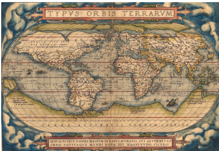
Typus Orbis Terrarum , de Abraham Ortelius. Museo Naval de Madrid