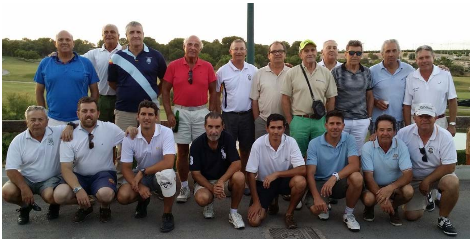
PARTICIPANTES PARTIDA JUNIO