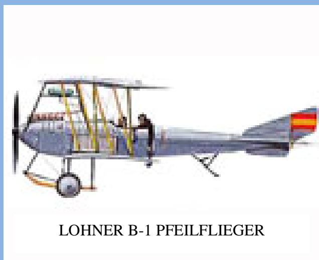
LOHNER B-1 PFEILFLIEGER

El 2 de abril de 1910 nace la aviación militar en España por medio de una Real Orden que decreta "el estudio, por los servicios de Aerostación, aeronáutica y aviación del tipo de aeroplano más conveniente para el ejército, así como la creación del laboratorio de aerodinámica".