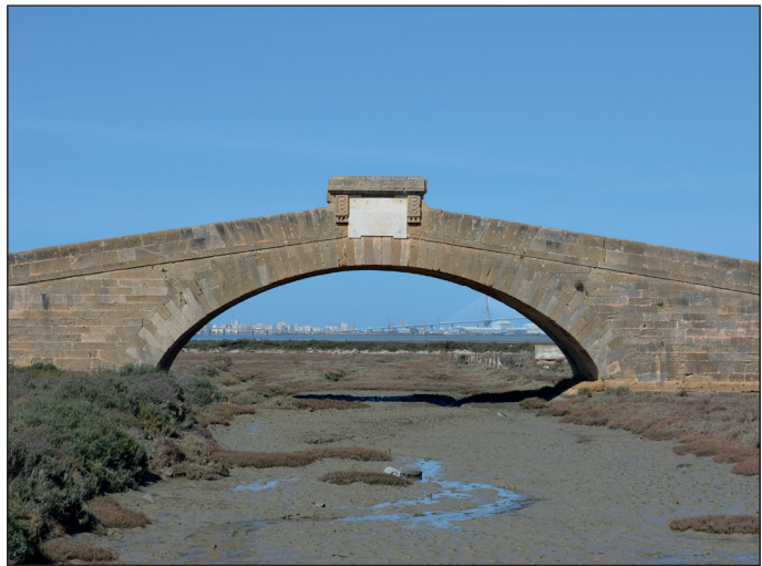
Puente de Ureña

En los años siguientes, las obras sufrieron continuos altibajos, paralizándose casi en su totalidad en 1794, como consecuencia de la drástica reducción del presupuesto de Marina. Una Real Orden de 28 de abril de 1795 disponía que se concluyera el sagrario para que sirviera de iglesia provisional, continuándose en lo preciso para preservar el templo de las inclemencias del tiempo, y que, concluidos los cimientos del convento, se trataría de formalizar un contrato para edificar aquél. En 1798 la Junta del Departamento presidida por D. José de Mazarredo, aceptó una propuesta del conde del Parque para finalizar las obras a finales del año 1799. Esta oferta no alcanzó en nada a la iglesia, aunque llegaron a su terminación el cuartel, la capitania general, la intendencia y el convento.