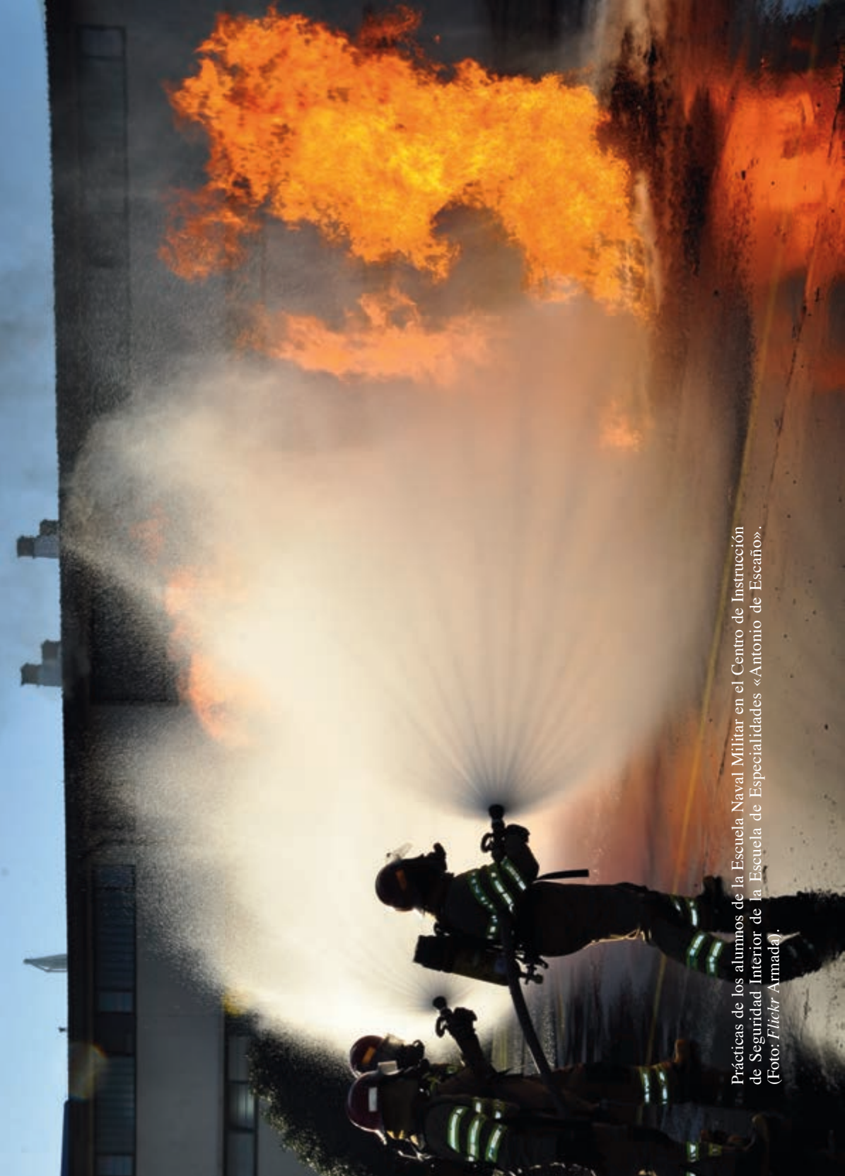
Prácticas de los alumnos de la Escuela Naval Militar en el Centro de Instrucción de Seguridad Interior de la Escuela de Especialidades «Antonio de Escañón».