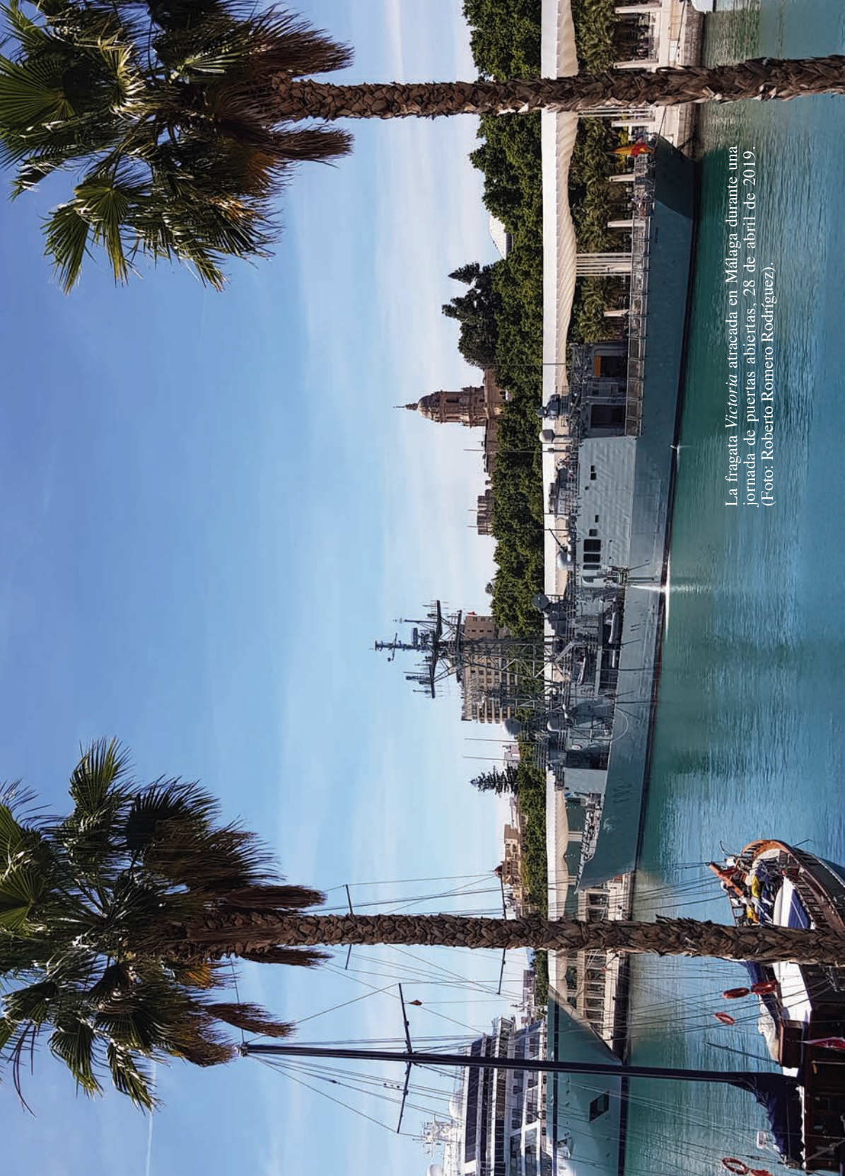
La fragata Victoria atracada en Málaga durante una jornada de puertas abiertas, 28 de abril de 2019. (Foto: Roberto Romero Rodríguez).