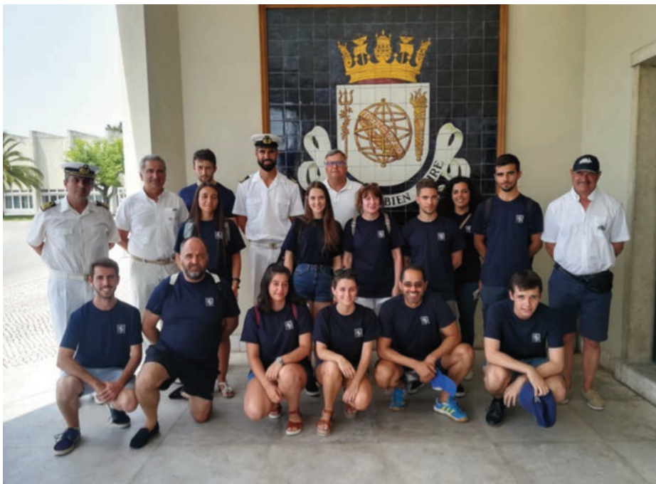
Dos directores (izq.), un profesor tutor de mar (dcha.) y los instruendos embarcados en la NRP Polar con su oficial imediato (centro) ante el blasón de la Escola Naval de Lisboa.

intentan con la UIM, que ha creado un programa de formación complementaria que concreta tal pretensión desde hace 15 años, 24 cursos y 20.000 millas recorridas.