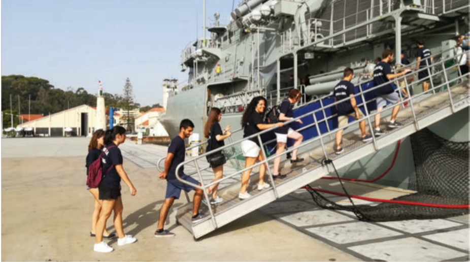
Los instruendos embarcando en el NRP Vasco da Gama para comenzar las sesiones del día.

fuera el mayor dique seco de Europa en un nuevo Manhattan al otro lado del Atlántico. Por el momento, su grúa-puente es un símbolo del paisaje lisboeta, lo mismo que los cacilheiros y a ponte (3); además, contiene la Base Naval de Lisboa, con sus instalaciones de apoyo a la Flota y a la Escuadrilla de Submarinos, distintos centros de Marinha , el Astillero, la Escola Naval, el Cuartel de Fuzileiros y la Escola Superior de Tecnologías Navais, creada en 1996 como producto de la transformación de varios institutos dedicados a la formación de oficiales técnicos, a partir de clases de suboficiales y plazas, y que cuenta con edificios del siglo XVIII primorosamente conservados y con unas vistas panorámicas de Lisboa que impresionan desde su frente en el río.