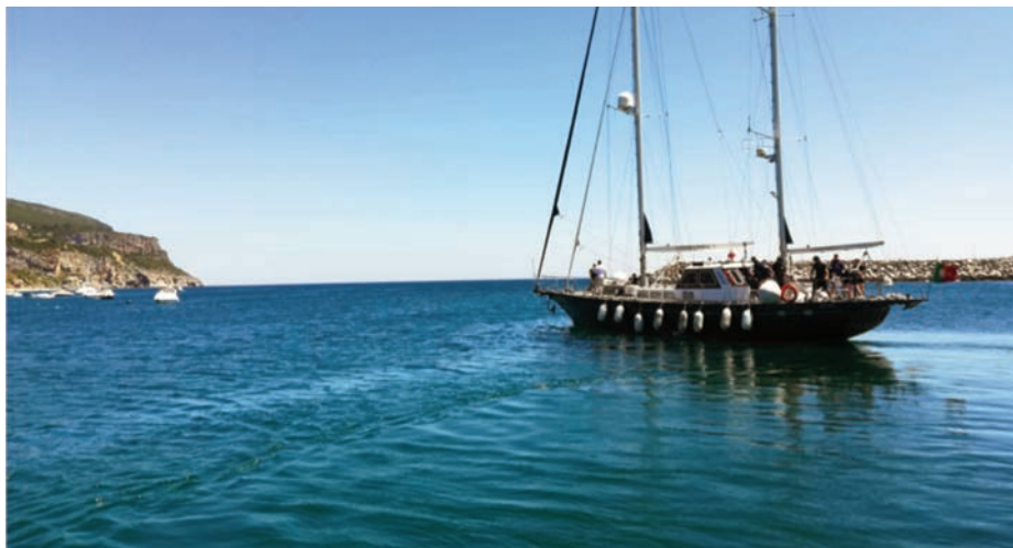
La NRP Zarco saliendo del puerto de Sesimbra con los instruendos a bordo.

Con el Campus volvíamos al comienzo de la UIM, cuando los cursos eran de 15 días, de los cuales una semana se realizaba en la Escola Naval o en Avilés y otra embarcados en el NRP Creoula . Desde este esquema la UIM evolucionó y llegó a consolidar un patrón de curso de 21 días que, a veces, se alargaban hasta 35 (Campaña 2012: Azores, y 2014: circunnavegación peninsular). Pero ahora que no se contaba con el Creoula debíamos reprogramar la de 2018, por lo que nos orientamos a generar una nueva plataforma para enseñar lo mismo: que uno solo es un náufrago y necesita de los otros para realizar sus proyectos, y cuando se organiza esta compañía surge un equipo que tiene sus reglas de compromiso, por lo que se trata de enseñarlas de