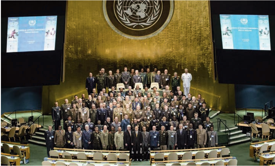
Reunión de jefes de Defensa de las Naciones Unidas el 27 de marzo de 2015.

Ningún país por sí solo puede hacer frente a amenazas globales del siglo XXI como la lucha contra las pandemias o contra los efectos del cambio climático. Una acción concertada sobre la base de un multilateralismo más fuerte resulta necesaria con la Organización de Naciones Unidas como principal referencia a nivel mundial» (3).