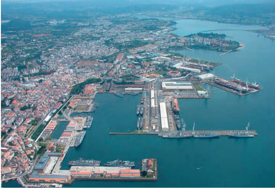
Vista aérea de Ferrol.

disfrutaban los militares en Estados Unidos a la hora de visitar edificios o participar en diferentes actividades, lo cual demostraba el cariño y respeto que los estadounidenses sienten por ellos. Nosotros también nos sentíamos reconocidos, como españoles y como militares.