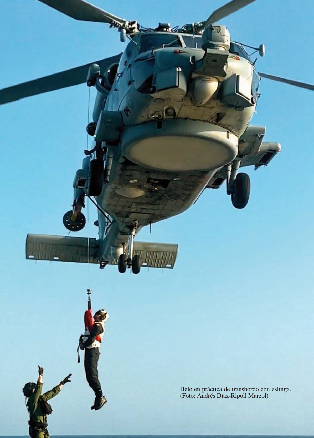
Helo en práctica de transbordo con eslinga.