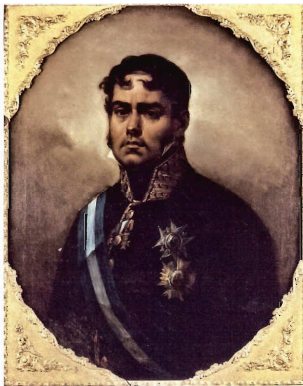
Pablo Morillo Anónimo español, s. XIX. Museo Naval de Madrid

Parte la Compañía de la Isla de León el 19 de junio incorporándose al Ejército en Utrera donde se realizaba su preparación táctica. Quedó encuadrada en la división de reserva al mando del general Lapeña y más tarde dentro de esta misma División como tropa de casa Real en el primer Batallón de Reales Guardias Españolas. Participaría en Bailén (en plena maniobra fue asignada a la División Reding con la que participó en el ataque según Rodríguez Delgado) y posteriormente en Tudela y Tarancón. Tras la retirada se agregaría ya en 1809 al segundo Regimiento de Infantería de Marina.