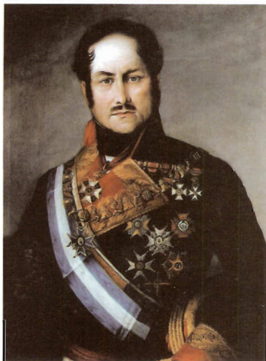
Juan Van Halen y Sarti. Alférez de navío Anónimo español c 1853. Museo Naval de Madrid

En palabras de Pío Baroja biógrafo de Van Halen: Ambos capitanearon a las masas y las condujeron al Parque de Monteleón, distribuyeron armas y colocaron a la gente en los lugares estratégicos siendo Van Halen herido en el hombro frente al mismo edificio del Parque.