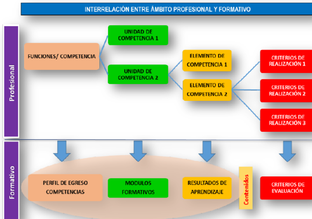
Figura 1: Interrelación entre el ámbito profesional y el formativo

La interrelación existente entre el ámbito profesional y el ámbito formativo, determinó la elaboración de los distintos elementos del ámbito profesional (unidades de competencia, elementos de competencia y criterios de realización), y el diseño de los correspondientes elementos en el ámbito formativo (módulos formativos, resultados de aprendizaje, metodologías, actividades formativas, sistema de evaluación y calificación, contenidos, criterios de evaluación, etc.), tal y como se muestra en la figura 1.