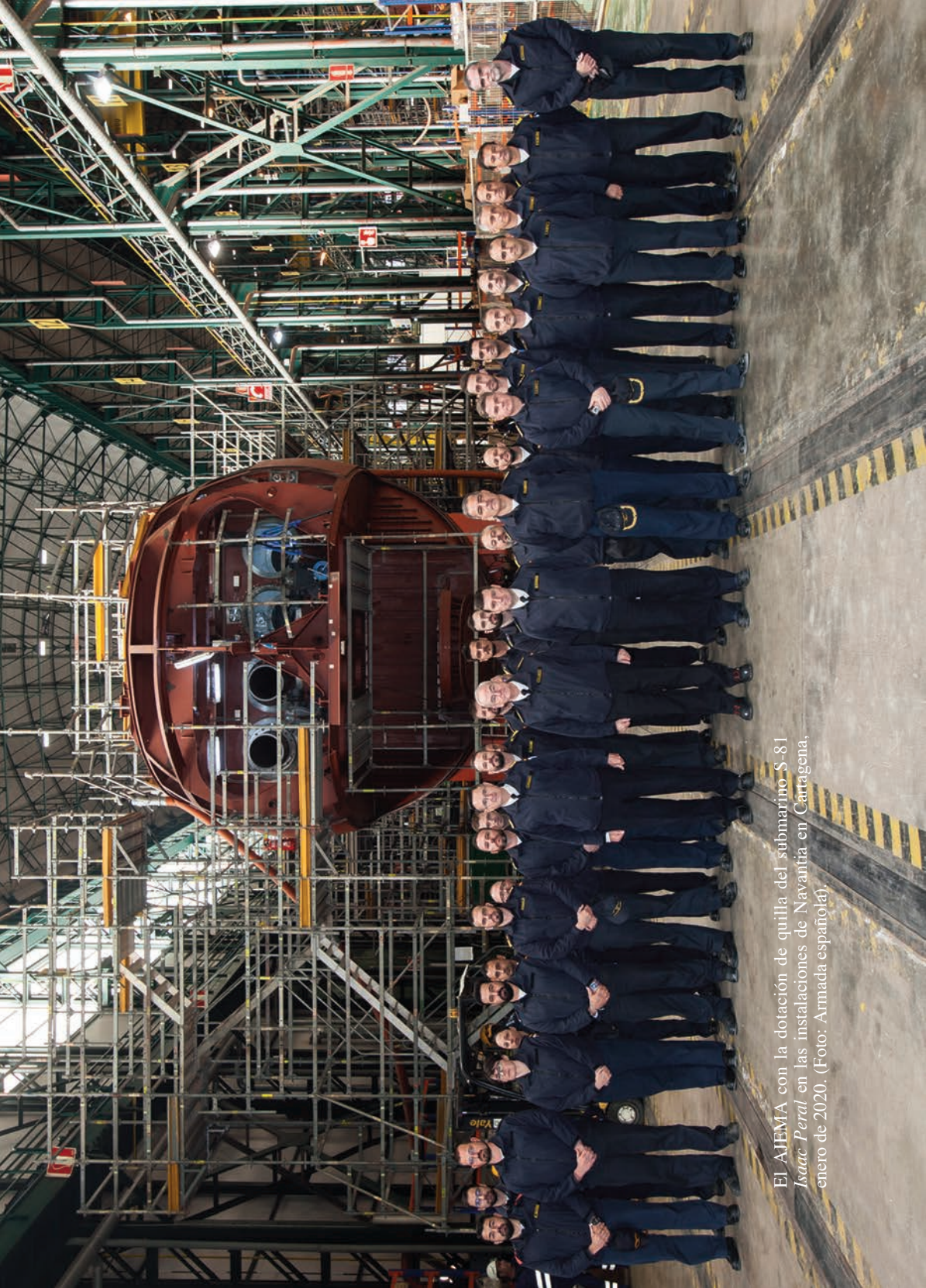
El AJEMA con la dotación de quilla del submarino S-81 Isaac Peral en las instalaciones de Navantia en Cartagena, enero de 2020.